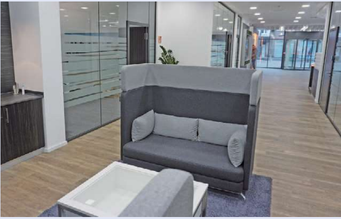
Schickes Mobilar, der neue Boden und Helligkeit tragen zum freundlichen Ambiente der runderneuten Geschäftsräume an der Franzstraße bei