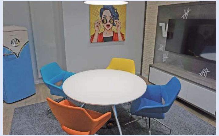
Ein Hingucker ist das speziell auf junge Kunden ausgerichtete Jugendzimmer. In die farbenfrohe Umgebung wurde ein stylischer Retro-Kühlschrank eingebettet (links)